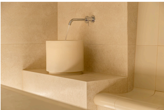
Bild 4 : Die Waschbecken sind Prototypen aus der Manufaktur Hilpert.