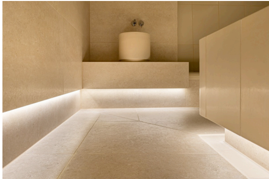
Bild 5 : Verdeckt liegende Lichtleisten unterstreichen die stimmungsvolle Atmosphäre. Die vom Nabelstein (rechts im Bild) herabrinneende Flüssigkeit fängt eine umlaufende Rinne am Boden auf.

Als Keramikmanufaktur mit einer mehr als sechzigjährigen Tradition bietet die Hilpert GmbH & Co. KG ein umfangreiches Sortiment handgefertigter Formteile für vielfältige Anwendungen. Neben Kaminen und Kachelöfen sind es heute vor allem Thermen und Bäder, in denen die formenreiche Keramik gefragt ist. Daher zählt außer der Herstellung der Keramik für Dampfbäder, Wärmeräume und Traumbäder insbesondere deren Konzeption und Ausführung zum Leistungsumfang. Private, öffentliche und gewerbliche Bauherren im In- und Ausland schätzen die ideenreichen Konzepte, das handwerkliche Know-how und die Innovationskraft des mittelständischen Unternehmens.