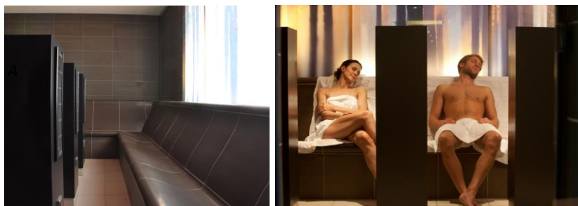
Bilder 3a und 3b: Milde Wärme umgibt den Badegast im Tecaldarium. Das Carpesol kombiniert in einzigartiger Weise Wärmestrahlungs- und Infrarottechnik.

Als Keramikmanufaktur mit einer mehr als fünfzigjährigen Tradition bietet die Hilpert GmbH & Co. KG ein umfangreiches Sortiment handgefertigter Formteile für vielfältige Anwendungen. Neben Kaminen und Kachelöfen sind es heute vor allem Thermen und Bäder, in denen die formenreiche Keramik gefragt ist. Daher zählt außer der Herstellung der Keramik für Dampfbäder, Wärmeräume und Traumbäder insbesondere deren Konzeption und Ausführung zum Leistungsumfang. Private, öffentliche und gewerbliche Bauherren im In- und Ausland schätzen die ideenreichen Konzepte, das handwerkliche Know-how und die Innovationskraft des mittelständischen Unternehmens. Eine Reihe namhafter Projekte wie die Wellnessbereiche und Thermen im Freizeitbad „Sieben Welten“ in Fulda, im Ferienkomplex „Weiße Wiek“ in Boltenhagen, im „Dünenmeer Hotel & Spa“ in Dierhagen, im Resorthotel am Obersalzberg in Berchtesgaden oder in der Tiroltherme Aqua Dome in Längenfeld sowie zahlreiche Thermenanlagen für Drei-, Vier- und Fünf-Sterne-Hotels und Privathäuser belegen dessen Kompetenz. Die Hilpert GmbH & Co. KG ist Mitglied von HUFLAND e.V.