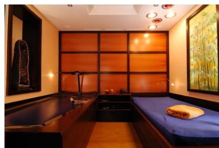
Aquathermojetliege (links) und Wasserbett (rechts) sorgen unter dem Besonnungshimmel für Entspannung in der Ruheneische.