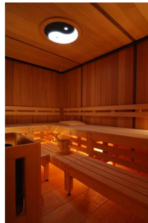
Hochwertiges Massivholz ist verantwortlich für das ausgezeichnete Saunaklima.