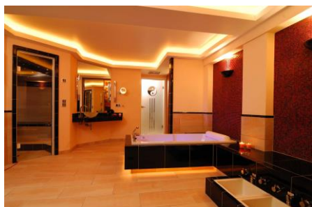
Wärmebank mit Fußbädern und Whirlwanne sind mit Handformkeramik der Serie „Cubus“ bekleidet.