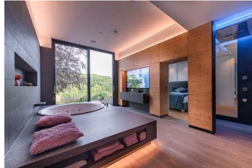
Bild 2: Hinter den Waschtischen fährt auf Wunsch ein TV-Monitor herunter.