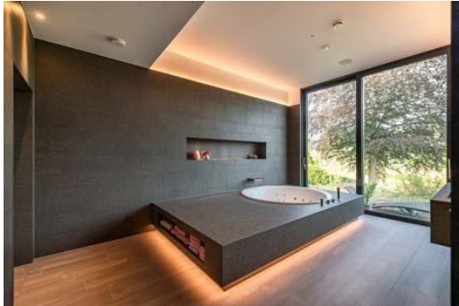
Bild 1: Das Bad kombiniert klare Linien und edle Materialien.