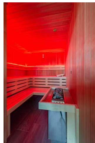
Bild 7: Entspannung finden die Bauherren in der Finnischen Sauna.