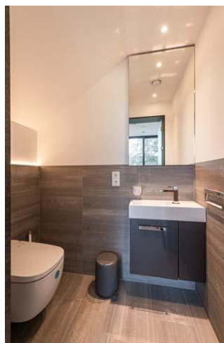
Bild 6: Ein WC darf auch in einem Traumbad nicht fehlen.