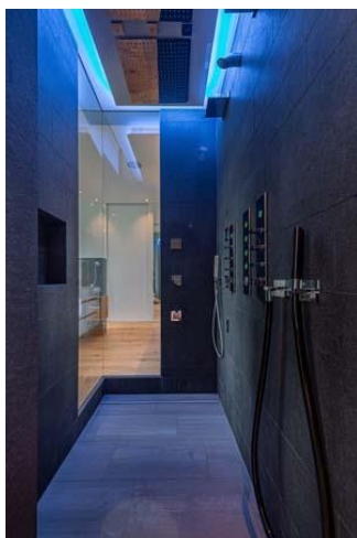
Bild 5: Die Dusche ist mit vielen Extras ausgestattet und teilt sich mit dem Schlafzimmer eine verglaste Ecke.