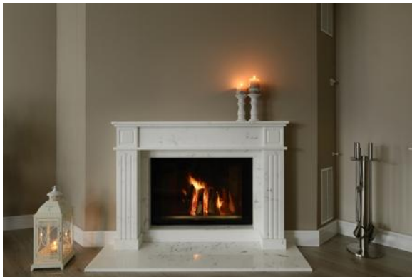
Bild 4: In der Villa schafft bereits ein Kamin von Hilpert eine angenehme Wohlfühlatmosphäre.