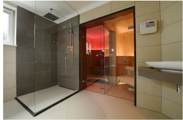
Bild 5: Auch ein bestehendes Spa von Hilpert sorgt für Entspannung und Regeneration der Hauseigentümer.