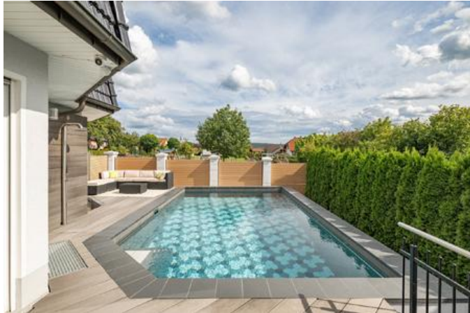
Bild 1: Den begrenzt zur Verfügung stehenden Raum nutzt das schmale Becken gekonnt aus.